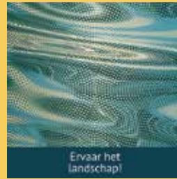
Ervaar het landschap!

www.brantsekempen.eu/portfolio-items/boek-leve-de-kleine-beerze/