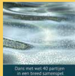
Dans met wel 40 partijen in een breed samenspel