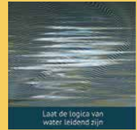
Laat de logica van water leidend zijn