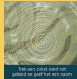
Trek een cirkel rond het gebied en geef het een naam