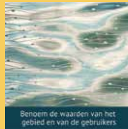
Benoem de waarden van het gebied en van de gebruikers