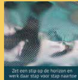
Zet een stip op de horizon en werk daar stap voor stap naar toe