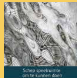
Schep speelruimte om te kunnen doen