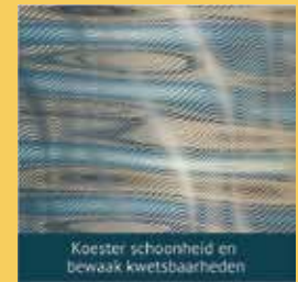
Koester schoonheid en bewaak kwetsbaarheden