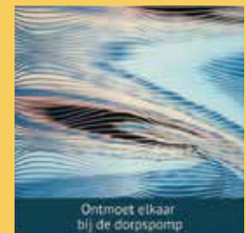
Ontmoet elkaar bij de dorpspomp